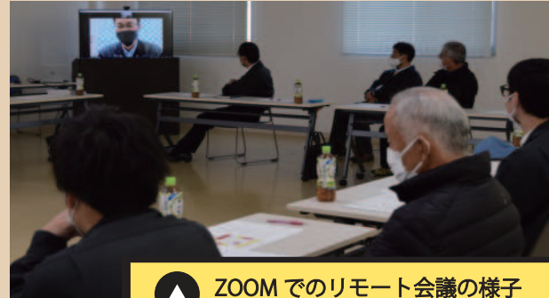
ZOOMでのリモート会議の様子 (ブロッコリー統一部会)