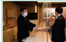
▲葬儀会場では、受付業務などを行います。

時代に伴い、最近では核家族化が進んだ背景等から、昔と比べ葬儀に対する認識や形態も変わってきています。ただ唯一、今も昔も変わらないものは、故人を偲び送り出すお気持ちです。そのお気持ちにどんなときも寄り添い、皆様の手助けができればと思っています。これから誠実に互助会の会員の方々に安心してお任せいただける葬祭窓口として尽力していきたいです。」