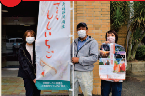
(写真：栗坂部会長と村職員)

佐那河内もいちご部会と佐那河内村は、官民協働プロジェクトとして、10月25日から担い手確保と生産振興を推進し、ブランドを次世代へと継承するため、「さくらもいちご」の一流農家を目指す、地域おこし協力隊の募集を開始しました。近年、村の人口減少や少子高齢化の影響により、農業の担い手の確保が問題となっており、部会でも高齢化等の影響から生産の減少が著しいことから、解決策として「佐那のいちご塾」を発足し、塾生を地域おこし協力隊として受け入れ、移住促進を行います。