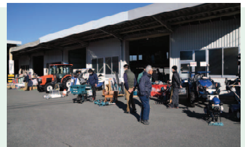
▲電動工具等を見学する来場者（南部営農経済センター）